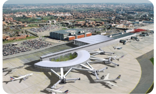
Construction du Hall D 80 M€ HT Aérogare de Toulouse Blagnac Missions : Maîtrise d'œuvre