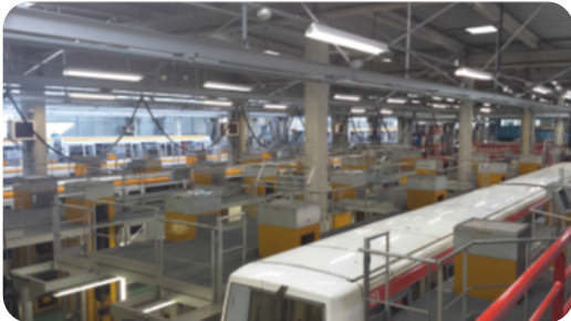
Extension des Garages Ateliers Basso Cambo et Borderouge TISSEO SMAT Toulouse 18 M€ HT Missions : Mandataire TCE