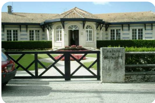
Extension Restructuration EHPAD à Ares Association des amis de l'oeuvre Wallerstein 8 M€ HT Missions : TCE - OPC